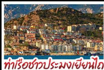
ท่าเรือชาวประมงเยียนไถ