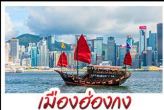
เมืองฮ่องกง

เมืองท่าชิงเต่า - วิวเมืองอ่องกง โรงเบียร์ชิงเต่า - ท่าเรือชาวประมงเยียนไถ