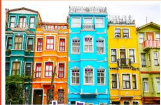
ย่านบลูลาก