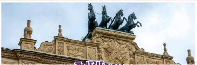
ฮิปโปโดรม