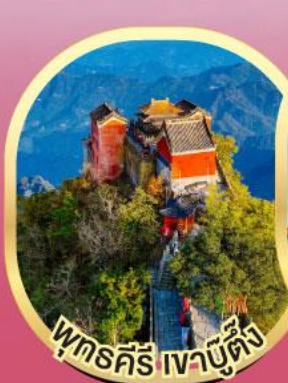
พุทธคีรี เจาบูต้ง