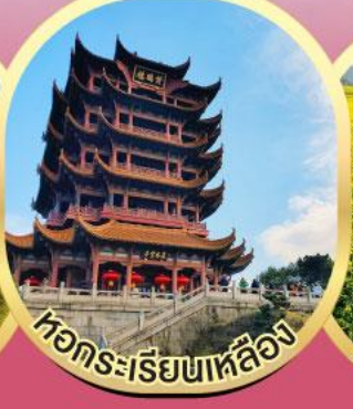
หวักระเรียนหลืออง