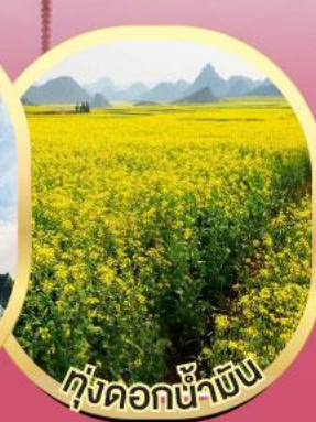
ทุ่งดอกขี้ขั๊น