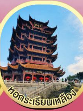
หวัศระเรี่ยนเหล็อง