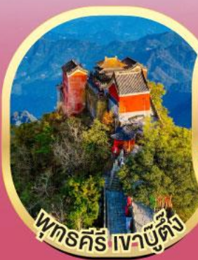
พุทธคีรี เจาบูตึง