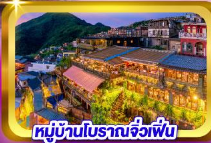
หมู่บ้านโบราณจิวเฟิ่น