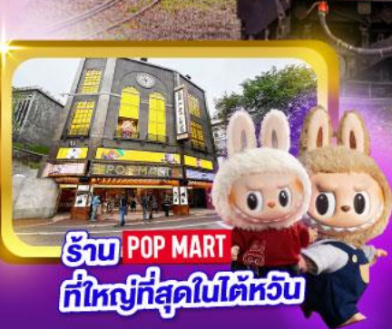
รับ POP MART ที่ใหญ่ที่สุดในไต้หวัน