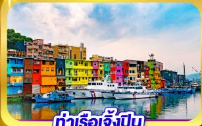
ท่าเรือเจิ้งปิง