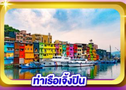
ท่าเรือเจิ้งปิง