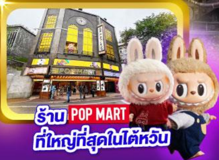
รับ POP MART ที่ใหญ่ที่สุดในไต้หวัน