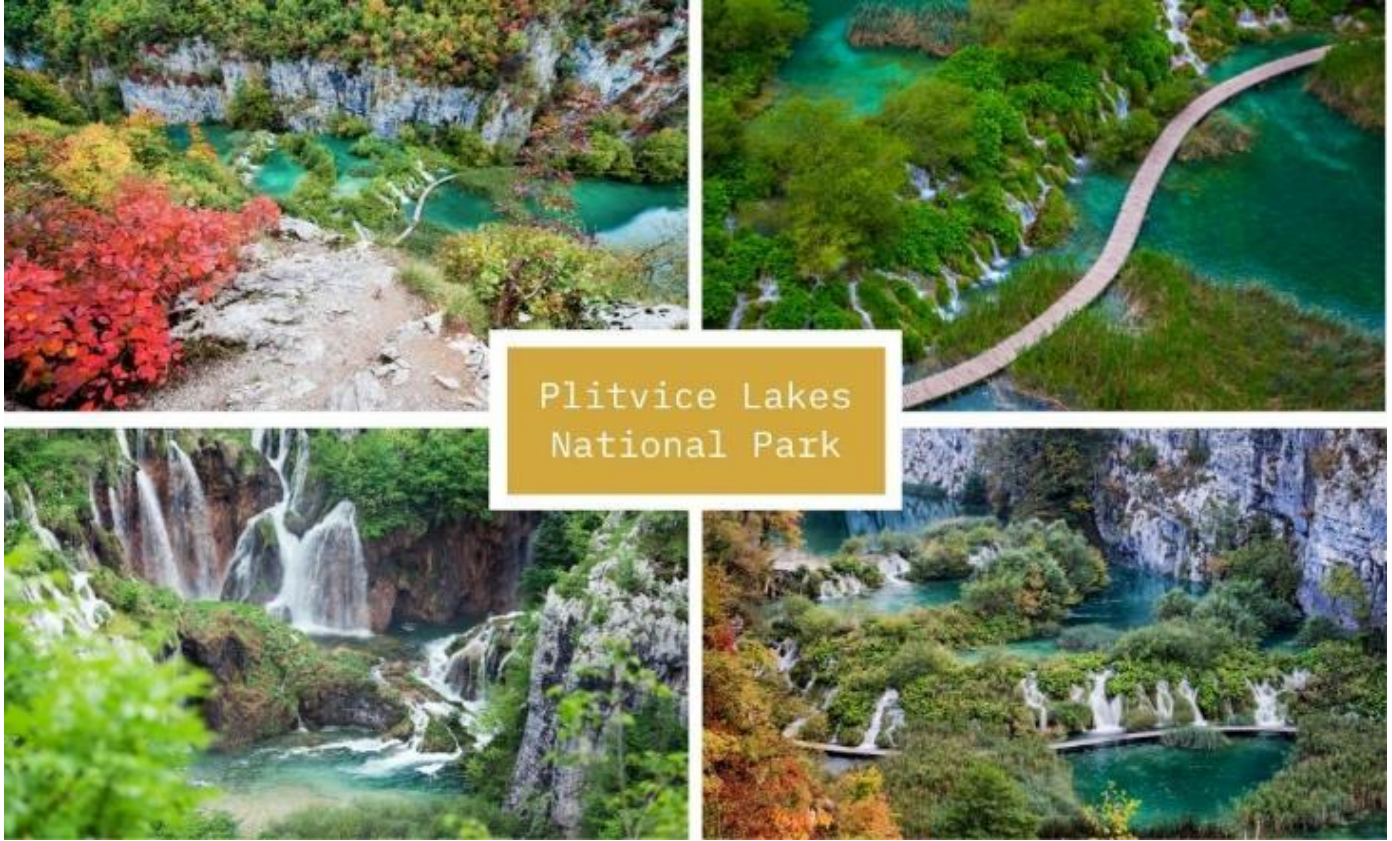
Plitvice Lakes National Park