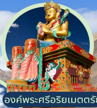
องค์พระศรีอริยเมตตรีย์