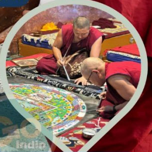
พระลามะ ผู้มีวัตรปฏิบัติ อันอัศจรรย์