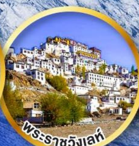
พระราชวังเลห์