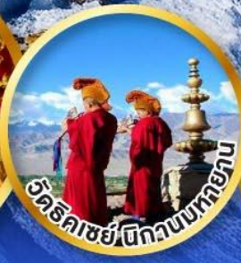
วัดริคาเซย์ นิกวบนทอยา