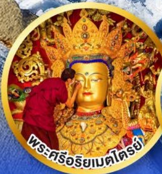
พระศรีอริยเมตไตรย์