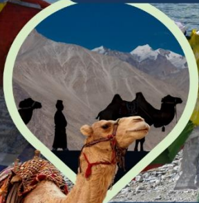
ซิลส์ ซ็ือซู่ ทะเลทราย กลางอ้อมกอดหิมาลัย