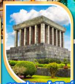
สุสานประธานโฮจิมินห์