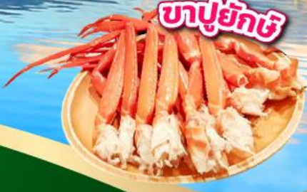
บาปุยักชิ

ชมวิวฟูจิ ริมทะเลสาบคาวากูจิโกะ อุโมงค์เสาโทริอิ ศาลเจ้าฟูชิมิอินาริ