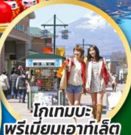
โกเทมบะ-พรีเมียมเอาก์เล็ท