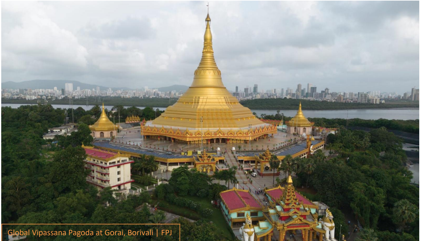
Global Vipassana Pagoda at Gorai, Borivali