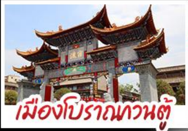
เมืองโบราณกวนคู้

ทุ่งดอกไม้สตาร์ดิสทองและรถไฟแดง - น้ำตกหวงกู่ซู่ หมู่บ้านเพ็งหลินปู้ยี่ - ซากุระบาน ณ หุบเขาอี่เหลียง เมืองโบราณกวนคู้ - วัดหยวนทง ถนนคนเดินหนานฉิงเจี๋ย + POP MART เมนูพิเศษ เปิดย่างอี่เหลียง