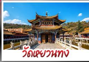
วัดเฉวาทง