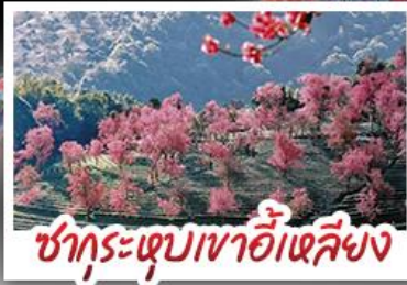
ซากุระเขุบเขาอี่เหลียง