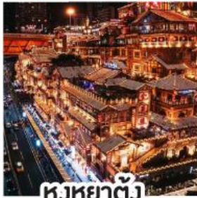
หวงหยาดัว

เดินทางจากนครแห่งชาติ "เจียงตู" ชม "ถนนคนเดินซุนซีลู่" ที่แสงไฟสะท้อนรอยยิ้ม สัมผัส "อุ๋หลง" ดินแดนมหัศจรรย์แห่งธรรมชาติ เยือน "หลุมฟ้าสามสะพานสวรรค์" ประตูแห่งเทพเจ้า เดินทางสู่ "ธงชิง" มหานครสามมิติแห่งแสงสี แสงนีออนเต้นระยิบระยับระหว่างสะพานสีทอง แล้วปล่อยหัวใจลอยท่ามกลางเมืองที่ไม่เคยหลับ