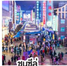
ซุนซีลู่