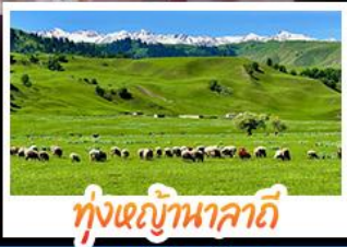
ทุ่งหญ้าหาลาคี