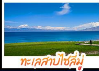
ทะเลสาบไซลีมู่

หุบเขาดอกท้อ - ทะเลสาบไซลีมู่ แกรนด์แคนยอนตู่ชานจื่อ - ทุ่งหญ้าหาลาคี