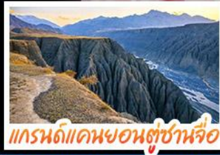
แกรนด์แคนยอนตู่ชานจื่อ