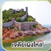
เจดีย์เฝิงโหล