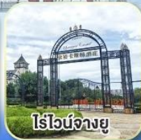
ไรไวน์จวงยู