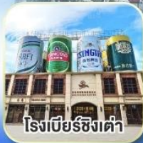
โรงแรมเบียร์ซิงเต่า