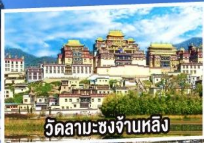
วัดลามะซงจ้านหลิง