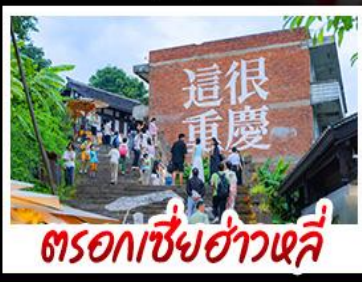
ตรอกเซี่ยฮ่าวหลี่