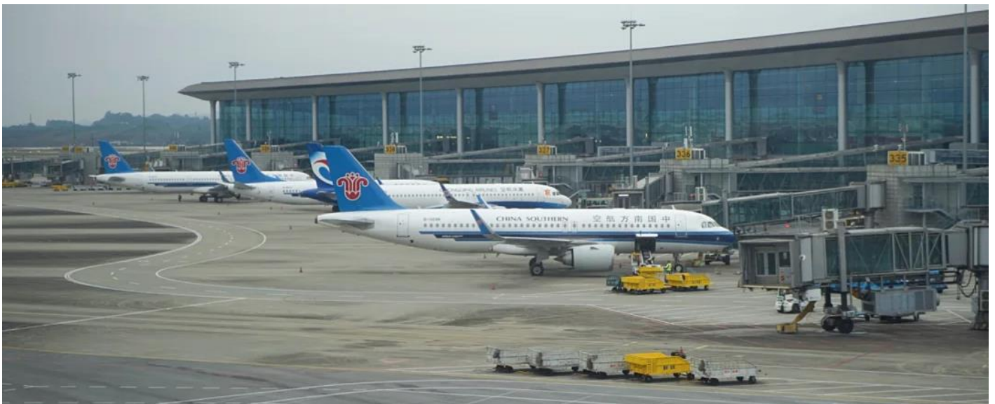
2UCKG-CZ005 บินตรงฉงชิ่ง ฟรีคอม ฟรีเดย์ สนุกสุดคุ้ม มหานครแปดมิติ 5 วัน 3 คืน โดยสายการบิน ไชน่า เซาเทิร์น (CZ)

00.30 น. ออกเดินทางจาก ท่าอากาศยานสุวรรณภูมิ อาคาร สู่ สนามบินฉงชิ่งเจียงเป่ย์ โดยสายการบิน ไชน่า เซาเทิร์น เที่ยวบินที่ CZ2362 05.00 น. เดินทางถึง ท่าอากาศยานนานาชาติสนามบินฉงชิ่ง เจียงเป่ย์ เมืองฉงชิ่ง มหานครที่ถูกสร้างขึ้นโดยทำหายทุกกฎเกณฑ์ของแรงโน้มถ่วงและภูมิศาสตร์ "เมืองภูเขา" ที่เติบโตและซ้อนทับกันเป็นชั้นๆ ตามหุบเขาและริมแม่น้ำ จนได้รับสมญานามสมัยใหม่ว่าเป็น "มหานคร 3 มิติสุดมหัศจรรย์" เมืองที่ท่านจะรู้สึกเหมือนหลุดเข้าไปในฉากภาพยนตร์ไซไฟ ที่ซึ่งชั้น 1 ของตึกหนึ่งอาจเชื่อมต่อกับชั้น 20 ของตึกข้างๆ, ที่ที่ท่านจะได้เห็นรถไฟฟ้าวิ่งทะลุกลางตึกอพาร์ทเมนต์, และที่ที่ Google Maps อาจต้องยอมแพ้ให้กับความซับซ้อนของถนนหนทางที่สร้างทับกันไปมาถึง 5 ระดับ จากนั้นนำท่านผ่านขั้นตอนตรวจคนเข้าเมือง รับกระเป๋าสัมภาระแล้ว นำท่านออกเดินทางเข้ารับประทานอาหารเช้า