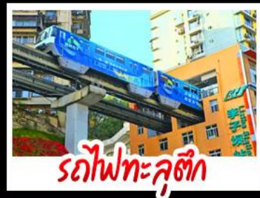
รถไฟทะลุติ๊ก