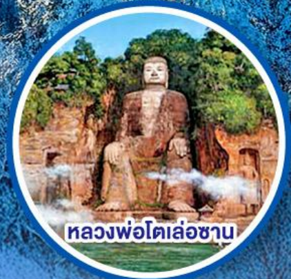
หลวงพ่อดิล่่อซาน