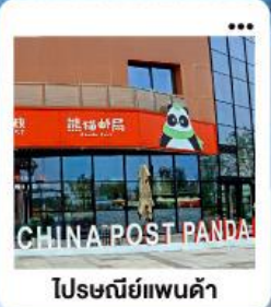
ไปรษณีย์แพนด้า