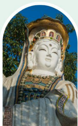
เจ้าแม่กวนอิม ธิพลสภย์