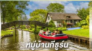
หมู่บ้านทีรูร์น