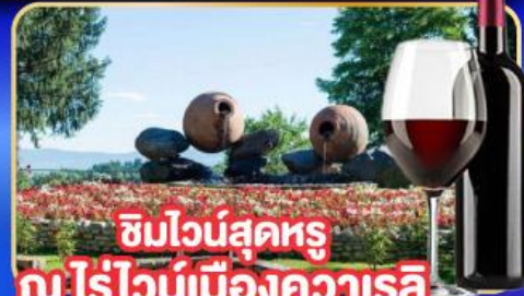
ชิมไวน์สูตร นไร่ไวน์เมืองควาเรลี