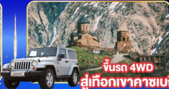
ขบวน 4WD สู่เทือกเขาคาซเบท