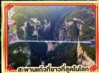
สะพานแกว่งที่ยาวที่สุดในโลก

เขาวงกต เทียนเหมินซาน สองเมืองโบราณ ฟูหลงเจิ้น เฟิ่งหวง