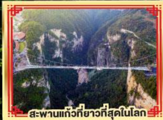
สะพานแกว่งที่ยาวที่สุดในโลก

เขาวังคาร เทียนเหมินซาน สองเมืองโบราณ ฟูหลงเจิ้น เฟิ่งหวง