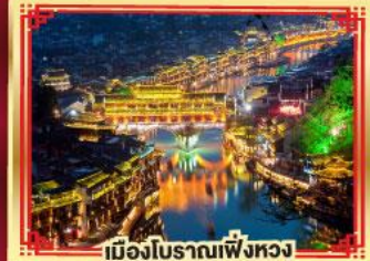
เมืองโบราณเฟิ่งหวง