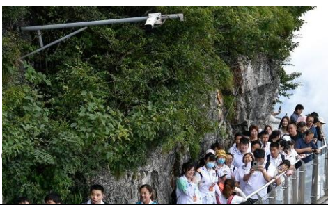
ประตู เขาอวตาร เทียนเหมินซาน สองเมืองโบราณ ผู่หลงเจิ้น เฟิงหวง 6 วัน 5 คืน โดย SL

กรณีที่กระเช้าหรือรถอุทยานหรือบันไดเลื่อนปิดปรับปรุงเนื่องจากซ่อมบำรุงหรือจากสภาพอากาศ ทั้งนี้เพื่อความปลอดภัยของลูกค้า ทางบริษัทฯจะจัดโปรแกรมอื่นมาทดแทนให้หรือเปลี่ยนแปลงตามความเหมาะสมอย่างใดอย่างหนึ่ง และในส่วนการนั่งรถของอุทยานขึ้นไปบนถ้ำประตูสวรรค์ หากรถของอุทยานไม่สามารถขึ้นไปถ้ำประตูสวรรค์ได้ ทางบริษัทฯ ขอสงวนสิทธิ์ไม่คืนเงินใดๆทั้งสิ้น โดยยึดตามประกาศจากทางอุทยานเป็นสำคัญโดยที่ไม่แจ้งให้ทราบล่วงหน้า