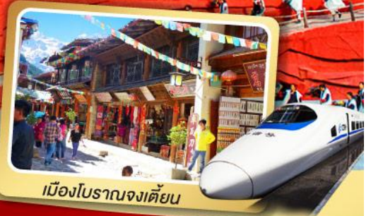
เมืองโบราณจงเตี้ยน