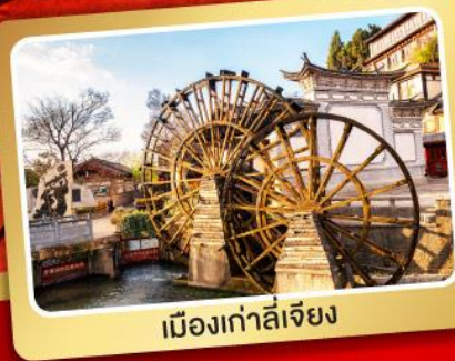
เมืองเก๋าลี่เจียง