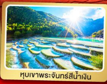
หุบเขาพระจันทร์สีน้ำเงิน