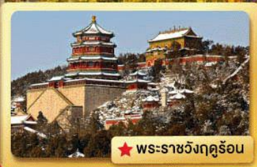
★ พระราชวังฤดูร้อน