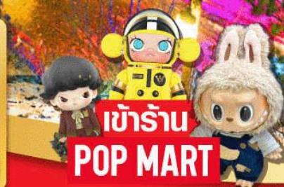
เข้าร้าน POP MART