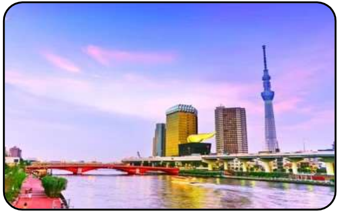
แม่น้ำซูมิดะ

สักการะ วัดมัตสึจิยามะโชเด็น หรือ “วัดหัวไชเท้า” ซึ่งเป็นวัดเก่าแก่ในย่านอาซากุสะ เป็นวัดเก่าแก่ในย่านอาซากุสะ กรุงโตเกียว ตั้งอยู่บนเนินเขาเล็ก ๆ ริมแม่น้ำซูมิดะ จุดเด่นคือเป็นวัดที่ขึ้นชื่อเรื่อง “ขอพรด้านการเงิน” โชคลาภ และความสำเร็จในธุรกิจ ส่วนไฮไลต์สำคัญของวัดนี้คือ ไคคอน หรือหัวไชเท้า สัญลักษณ์ศักดิ์สิทธิ์ คนที่นี้เชื่อว่าไคคอนช่วย “ชำระล้างสิ่งไม่ดี” และนำโชคลาภเข้ามา นักท่องเที่ยวมักนำไคคอนไปถวายเพื่อขอพร