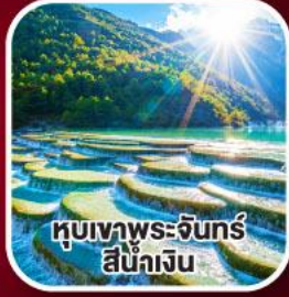
หุบเขาพระจันทร์ สีน้ำเงิน