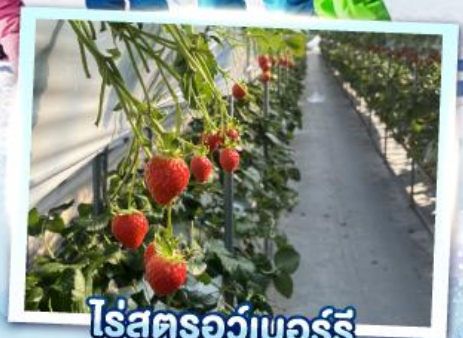
ไร่สตรอว์เบอร์รี่