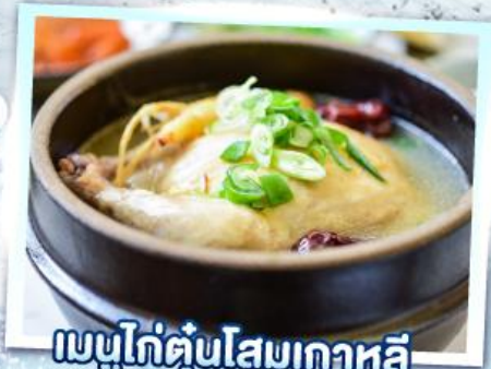
เมนูไก่ตุ๋นโสมเกาหลี