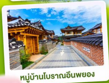
หมู่บ้านโบราณอินพยอง