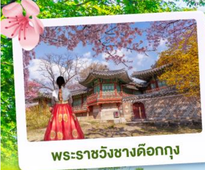
พระราชวังชางด็อกกุง