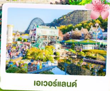
เอเวอร์แลนด์