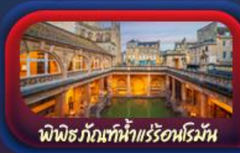
พิพิธภัณฑ์น้ำแร่ร้อนโรมัน