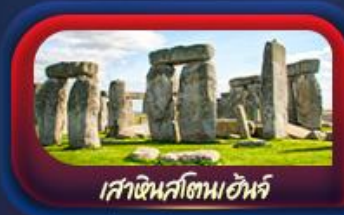
เสาหินสโตนเฮนจ์