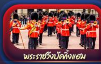
พระราชวังบักกิงแฮม