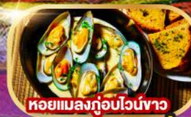
หอยแมลงภู่นิวอิงชาว