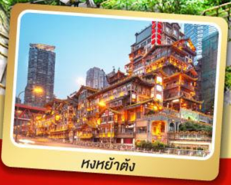
หงหย่าตัง