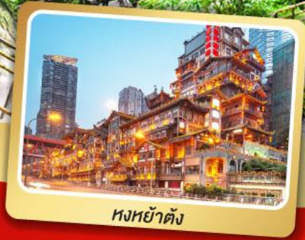
หงหย่าตัง