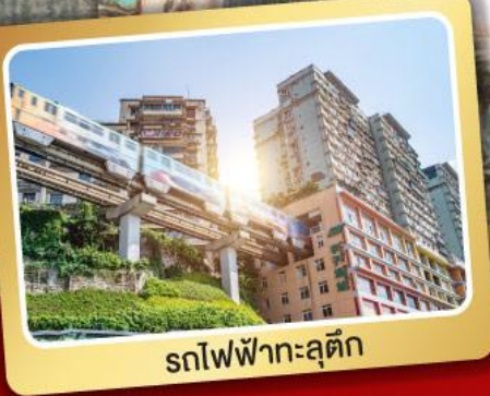
รถไฟฟ้ากะลุดัก