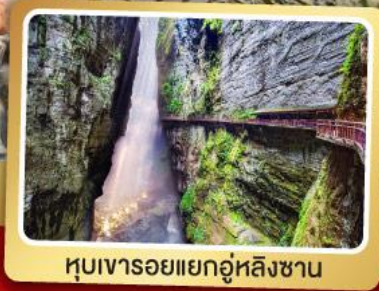
หุบเขารอยแยกอุ๋หลิงซาน