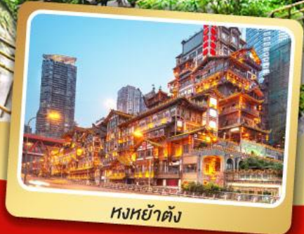
หงหย่าตัง

แบบพิเศษ สุกี้ที่มีไอโฟงซึ่ง,เปิดปีกกิ้ง