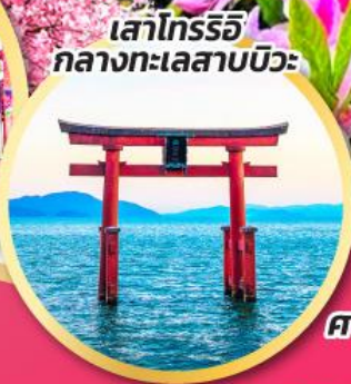
เสาโทริอิ กลางทะเลสาบบิวะ