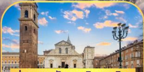
ถ่ายภาพกับมหาวิหารตูริน