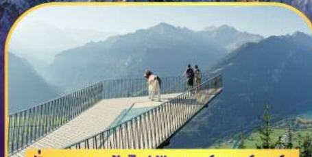
นั่งรถกระเช้าไฟฟ้า ชาร์เตอร์ ดูล์ม