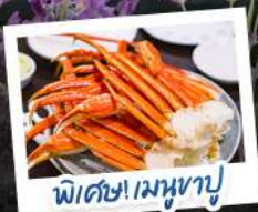
พิซซ่าเมฆงาปู