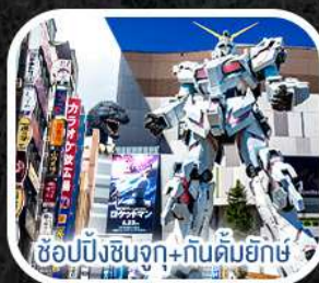
ช้อปปิ้งชินจูกุ+กินคัมยักษ์