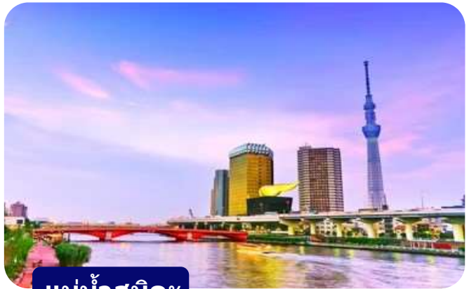
แม่น้ำสุมิดะ

ส่วนไฮไลต์สำคัญของวัดนี้คือ ไตคอน หรือหัวไข่เท้า สัญลักษณ์ศักดิ์สิทธิ์ คนที่นี่เชื่อว่าไตคอนช่วย "ชำระล้างสิ่งไม่ดี" และนำโชคลาภเข้ามา นักท่องเที่ยวมักนำไตคอนไปถวายเพื่อขอพร