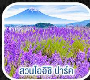
สวนโออิชิ ปาร์ค