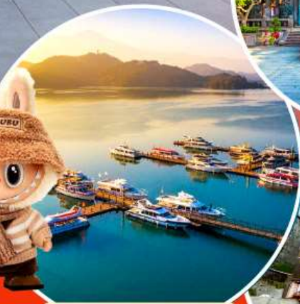
ทะเลสาบสุริยขึ้นจันทรา