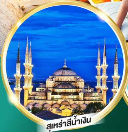
สุเหร่าสีน้ำเงิน