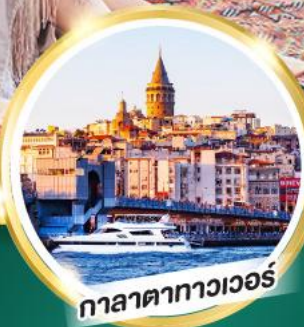
กาลาตาทาวเวอร์