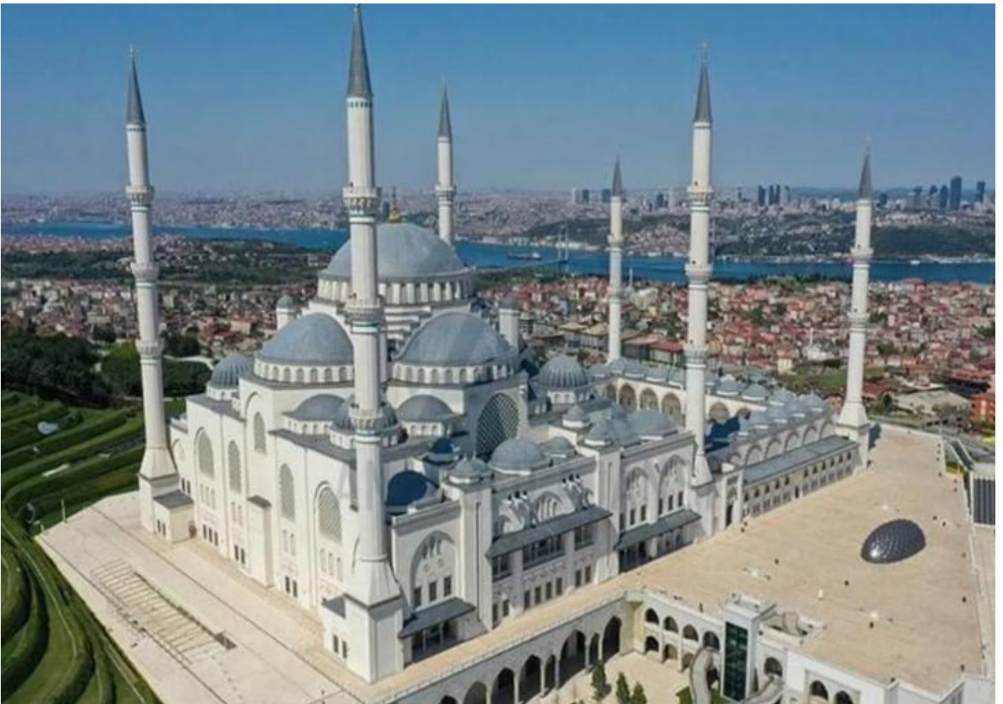
คำ รับประทานอาหารค่ำ ณ ภัตตาคารพื้นเมือง

นำท่านเข้าชมสุเหร่ายักษ์หรือมัสยิดคามลิกา Camlica Great Mosque ที่ได้รับการบันทึกว่าเป็นมัสยิดที่มีรูปแบบทันสมัยด้วยสถาปัตยกรรมแบบผสมผสานอย่างลงตัวของบาร็อคและเซลจุก และมีขนาดใหญ่ที่สุดของตุรเคียโดยมีเนื้อที่กว่า 57,500 ตารางเมตร จุผู้คนได้ถึง 63,000 คน มีหอคอยสูงตระหง่านถึง 6 หอคอย สื่อถึงชัยชนะของชาวเติร์กที่ชนะในการทำสงครามกับพวกไบเซนไทน์เมื่อปี ค.ศ.1071 และโดมหลักมีความสูงกว่า 72 เมตรสามารถมองเห็นได้จากทุกทิศทางของกรุงอิสตันบูล (มัสยิดไม่สามารถเข้าชมได้ กรณีที่มีการทำละหมาด)