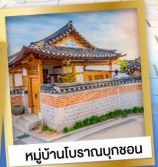
หมู่บ้านโบราณบุกซอน