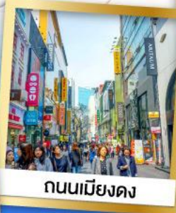
ถนนเมียงดง