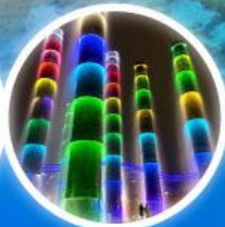
น้ำพุไม้ไฟ SKP