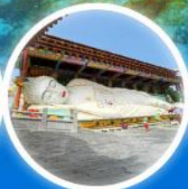
พระนอนยาวที่สุดในเอเชีย