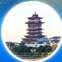
หอเยว่หวัง