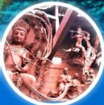
วัดเซียงฮุย