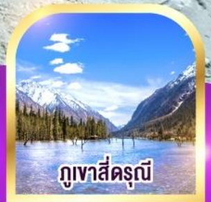
ภูเขาสี่ตรุนี