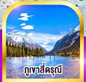
ภูเขาสัตรุณี