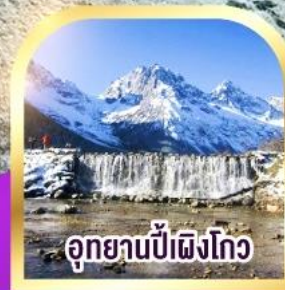
อุทยานปี่ผิงโก