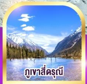
ภูเขาสี่ตรุนี