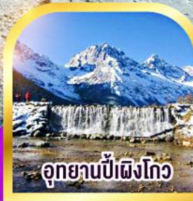
อุทยานปี่เผิงโก