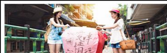
ปลั๋วอโคมลอยซือเฟิน