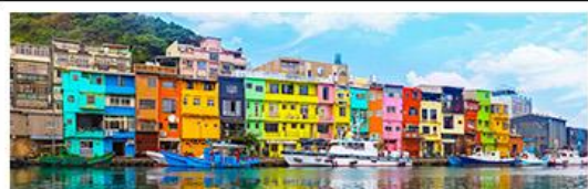
หมู่บ้านหลากสี ZHENGBIN

18 - 21 ก.ค. 69 | 12 - 15 ก.ย. 69 15 - 18 ส.ค. 69 | 28 - 31 ต.ค. 69