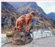
ช่องแคบเล็กระโงน