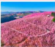
หุบเขาหยี่หลีฮยง