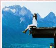
ร้านอาหารเฟยฮุนต้ออัน