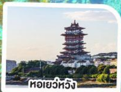
หอเยว่หวัง