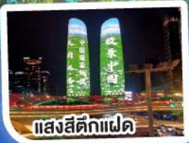
แสงสีตึกแฝด