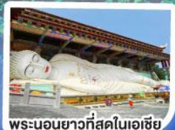
พระนอนยาวที่สุดในเอเชีย