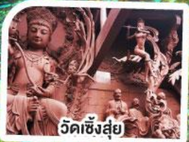
วัดเซียงสู่ย