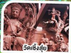
วัดเชิงสุ่ย