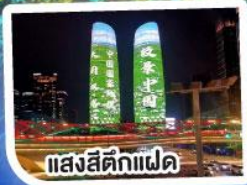
แสงสีติ๊กแฝด