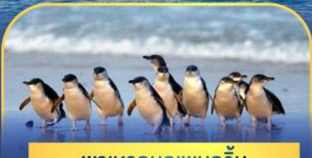
พาเหรดนกเพนกวิน