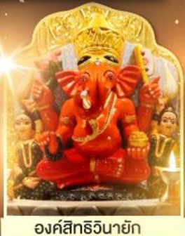
องค์สิทธีวินายก