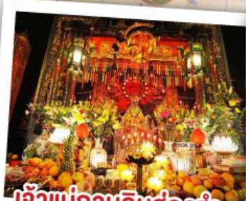
เจ้าแม่กวนอิมฮ้องฮำ