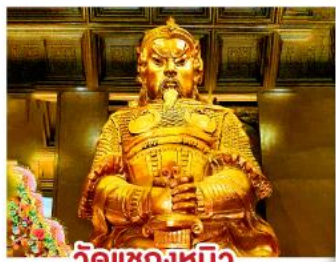
วัดเขangkหมิว