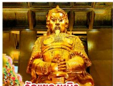
วัดแซกงหมิว