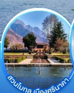
สวนโมกุล เมืองศรีนาตา