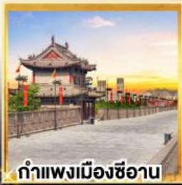
กำแพงเมืองซีอาน