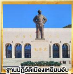
ฐานปฏิวัติเมืองเหยียนอัน