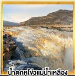
น้ำตกหูโหว่แม่น้ำเหลือง