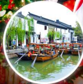
เมืองโบราณซูโจว

ท่องเที่ยวตลาดคริสต์มาสเซี่ยงไฮ้ พร้อมตะลุยดิสนีย์เต็มวัน!!