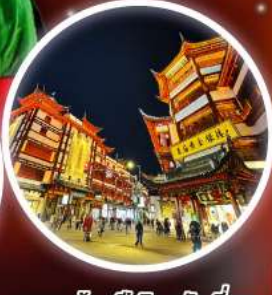
ตลาดร้อยปีฉินหวงเหมียว