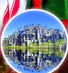
อาคารพันคีนโม่