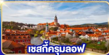
เซสท์ক্রุมลอฟ