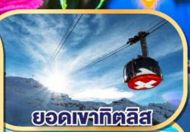
ยอดเขากิตลิส