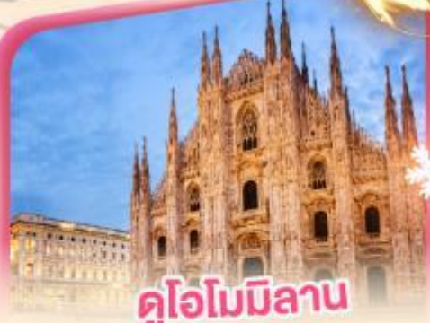
คูโอโมมิลาโน