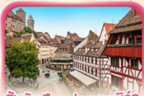
สัมผัสเมืองเก่าบูเรมเบิร์ก