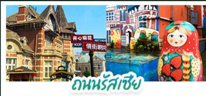
ถ่านรัสเซีย