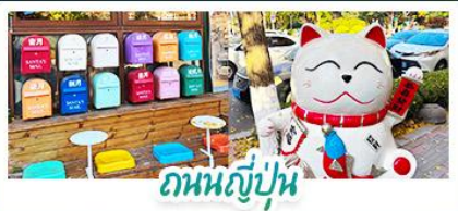
ถ่านญี่ปุ่น

ไฮไลท์ ท่าเรือประมง • เวนิสจำลอง ทุ่งหญ้าหุบสวน • ชายแดนจีนเกาหลี